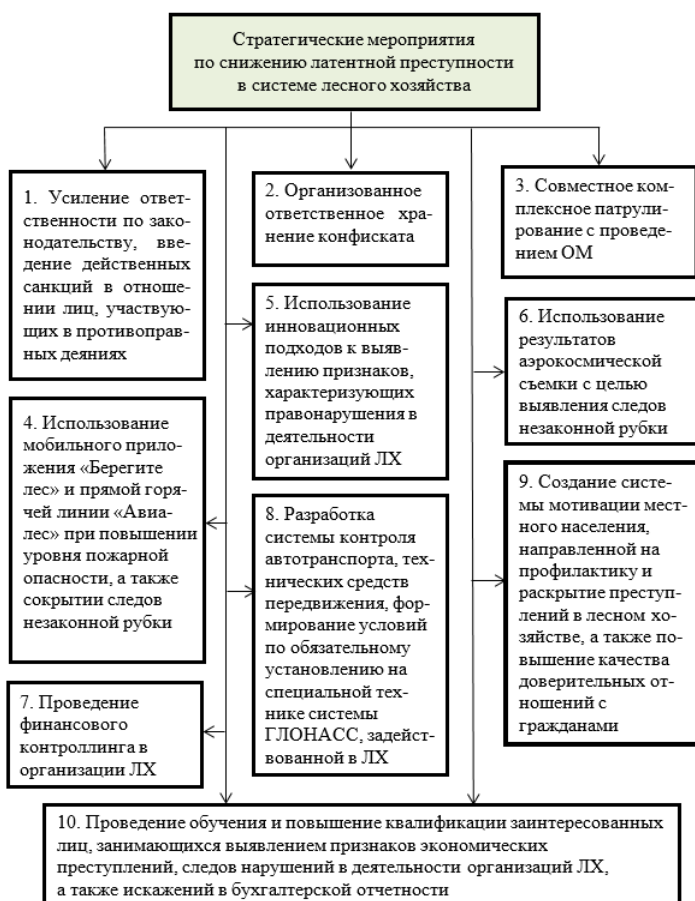
Рисунок 4 – Стратегические мероприятия по снижению латентной преступности в системе ЛХ

Предложенный план мероприятий содержит десять основных пунктов, которые способствуют совершенствованию правового регулирования, организационные мероприятия, мероприятия по повышению эффективности деятельности федерального лесного надзора (охраны) и пресечению незаконных заготовок и оборота древесины. Каждый пункт рассчитан автором по сроку реализации. Выявлены основные статьи затрат по каждому из рассматриваемых направлений. Особое внимание уделено мотивационной работе с жителями муниципальных районов с использованием дополнительных финансовых ресурсов (рис. 4).