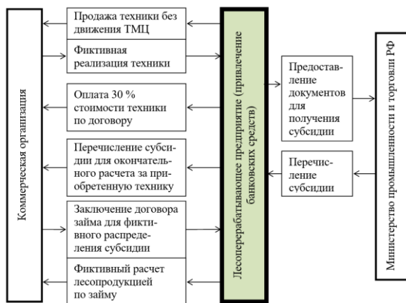
Рисунок 3 – Схема хищения субсидий на приобретение основных производственных фондов в ЛХ

4. Обоснована система мероприятий по снижению латентной преступности, имеющая стратегическое значение и включающая организационные мероприятия, мероприятия по повышению эффективности деятельности федерального лесного надзора (охраны) и пресечению незаконных заготовок и оборота древесины по декриминализации сферы лесного хозяйства; раскрыты особенности применения предлагаемых мер в сфере лесного хозяйства.