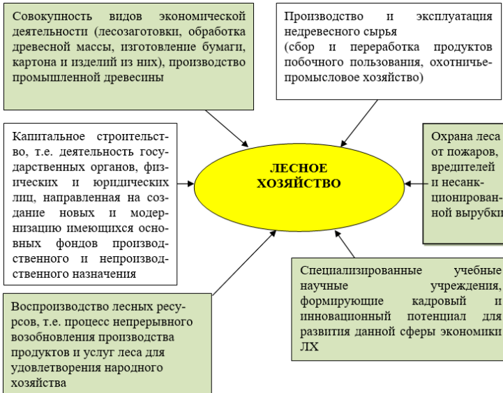
Рисунок 1 – Основные составляющие лесного хозяйства

таких как взяточничество, коррупция, превышение должностных полномочий, переходящих порой в организованное преступное сообщество.